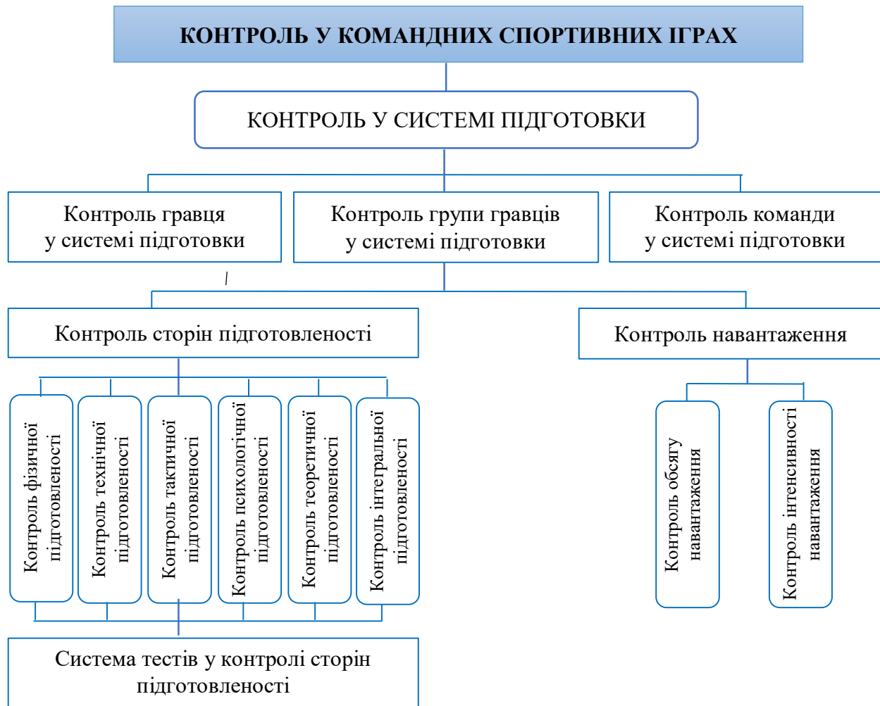
Рисунок 1. Елементи ієрархії наукових знань щодо контролю сторін підготовленості спортсменів у командних спортивних іграх

Для комплексного контролю підготовленості баскетболістів й для контролю кожного з видів підготовленості окремо на кожному етапі багаторічної підготовки має бути сформована система тестів, що матиме власні специфічні особливості, які ґрунтуватимуться на аналізі останніх наукових досліджень у командних спортивних іграх та узгоджуватися з сучасними теоретичними положеннями системи підготовки спортсменів у олімпійському спорті та контролю. Основна розбіжність цієї системи тестів від циклічних видів спорту полягає у тому, що на кожному етапі багаторічної підготовки структура