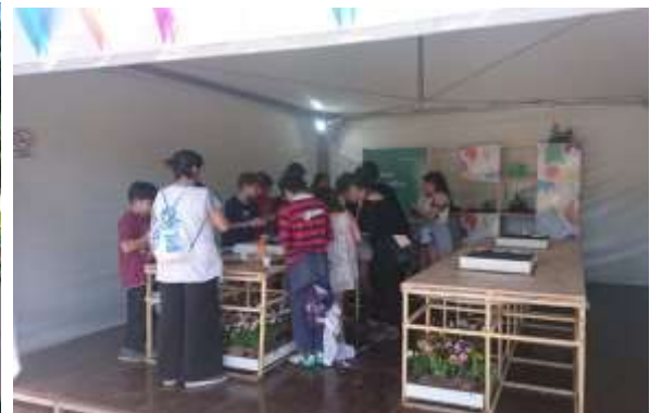
Рисунок 4. Освітні еко-програми для молоді на літніх Юнацьких Олімпійських іграх у 2018 р. (Буенос-Айрес, Аргентина)

Також важливу роль у формуванні екологічного світогляду молоді відіграє участь у Всеукраїнському спортивно-масовому заході серед дітей «Олімпійське лелечення», яке щороку проводить НОК України, починаючи з 2011 р. Захід спрямований на реалізацію одного із важливих напрямів діяльності Міжнародного олімпійського комітету – заохотити дітей та молодь у всьому світі