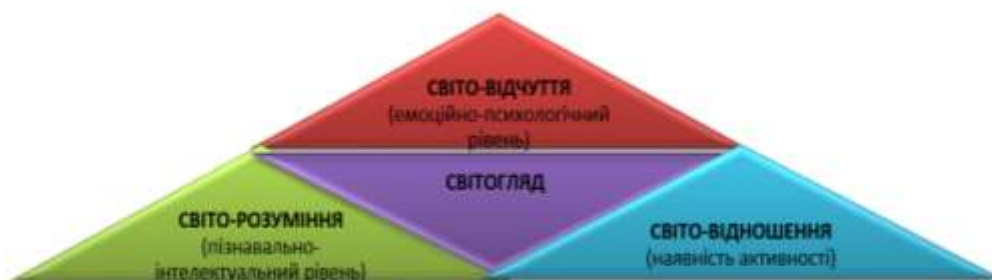
Рисунок 2. Світогляд особистості (за В. Шинкарук [15])

ціннісні орієнтації (рис. 2). Тож, І. Надольний [5], І. Хайрулліна [16] аналізують світогляд як систему поглядів, яка визначає загальну спрямованість діяльності і поведінки людини та є найвищим синтезом знань, практичного досвіду та емоційних оцінок.