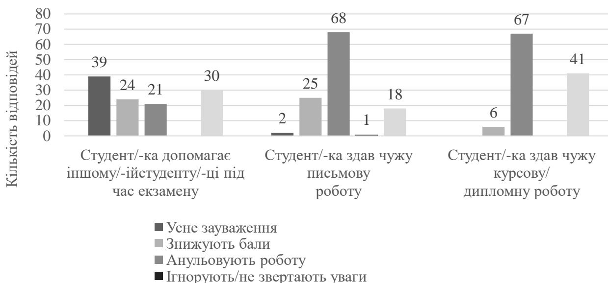
Рисунок 2. Результати анкетування здобувачів, а саме відповіді на запитання: «Що зазвичай роблять викладачі, якщо..?» (n = 114)

Завдяки опитуванню здобувачів вищої освіти, було визначені, які все ж таки, прояви академічної не доброчесності, були помічені саме респондентами. Так, 63% опитуваних – не помічали даних проявів. 32,5 % здобувачів помічали списування, 15 % – академічний плагіат. Такі дані підтверджують, що все ж таки більша кількість опитуваних дотримуються правил академічної доброчесності