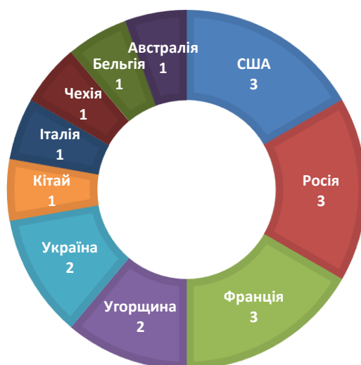
Рисунок 1. Співвідношення кількості призових місць, зайнятих національними жіночими збірними командами у чемпіонатах світу з баскетболу 3x3

Порівняльний аналіз досягнень на чемпіонатах світу з баскетболу 3x3 серед національних жіночих збірних команд з 2012 року свідчить, що у шести чемпіонатах світу призерами ставали команди 10 країн, з них три, а саме США, Росії та Франції ставали тричі призерами, команди Угорщини та України двічі, і інші команди п'яти країн по одному разу (рис. 1) [20].