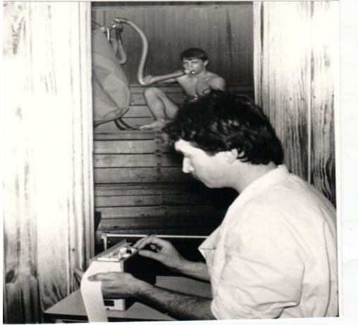
Фото: Проведення функціональних досліджень юного спортсмена в умовах сауни автором статті (1989): робочий момент

Дослідження проводилися індивідуально з кожним обстежуваним (фото).